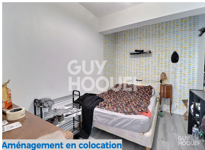
Aménagement en colocation