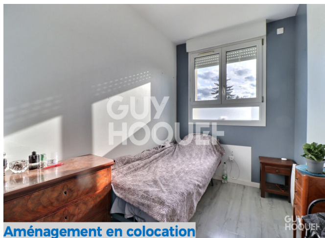
Aménagement en colocation