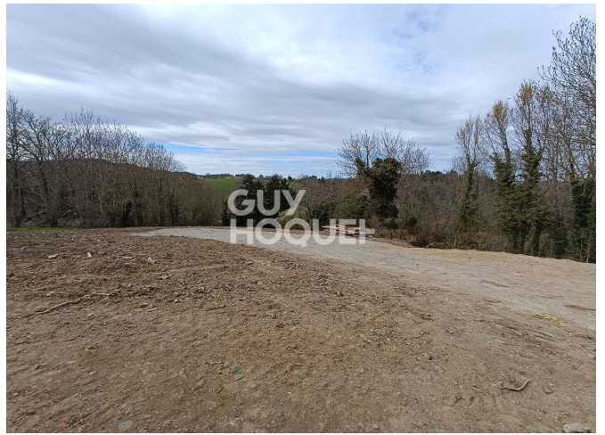
Façade Nord Ouest