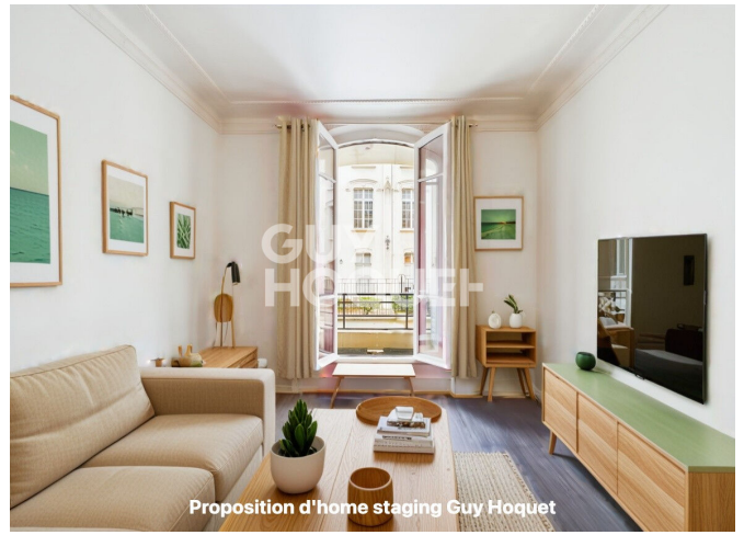
Proposition d'home staging Guy Hoquet