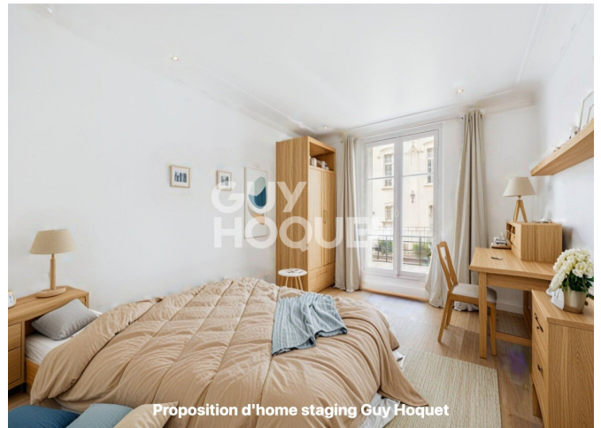
Proposition d'home staging Guy Hoquet