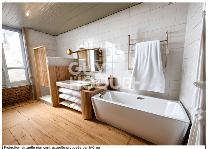
Projection virtuelle non contractuelle proposée par IACrea