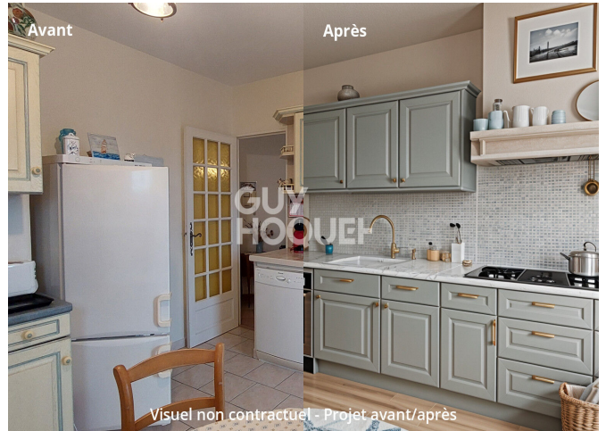
Visuel non contractuel - Projet avant/après