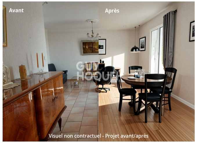
Visuel non contractuel - Projet avant/après