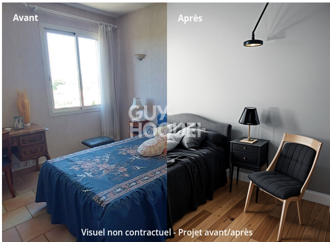
Visuel non contractuel - Projet avant/après