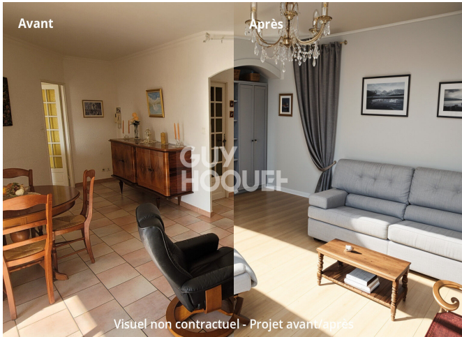
Visuel non contractuel - Projet avant/après