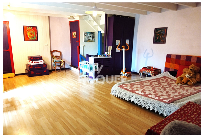
Contactez GUY HOQUET LANVALLAY au 02-79-76-87-86