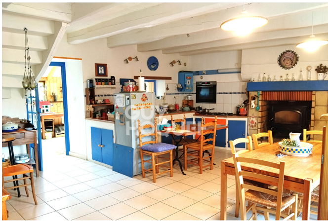
Contactez GUY HOQUET LANVALLAY au 02-79-76-87-86