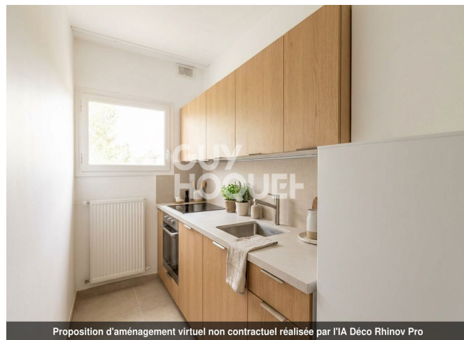
Proposition d'aménagement virtuel non contractuel réalisée par l'IA Déco Rhinov Pro