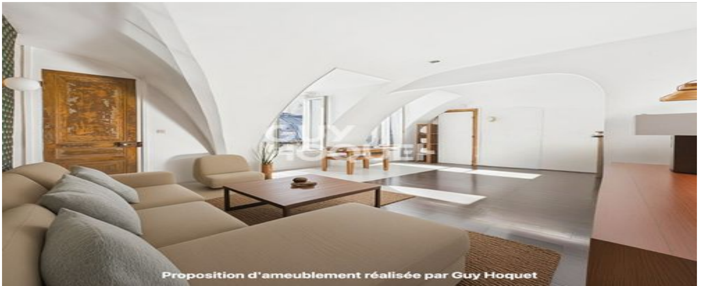
Proposition d'ameublement réalisée par Guy Hoquet