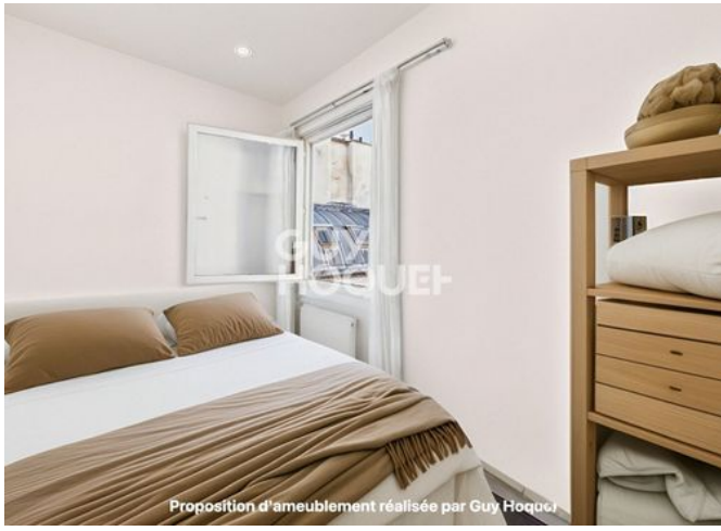
Proposition d'ameublement réalisée par Guy Hoquet