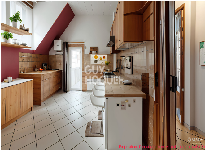
Proposition d'aménagement virtuel non contractuelle