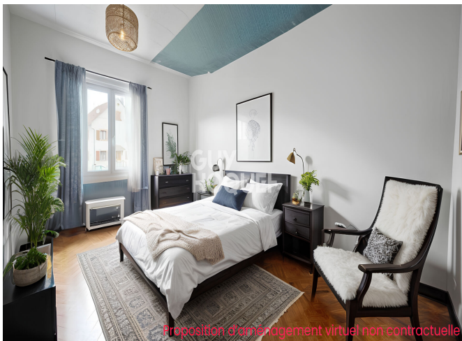
Proposition d'aménagement virtuel non contractuelle