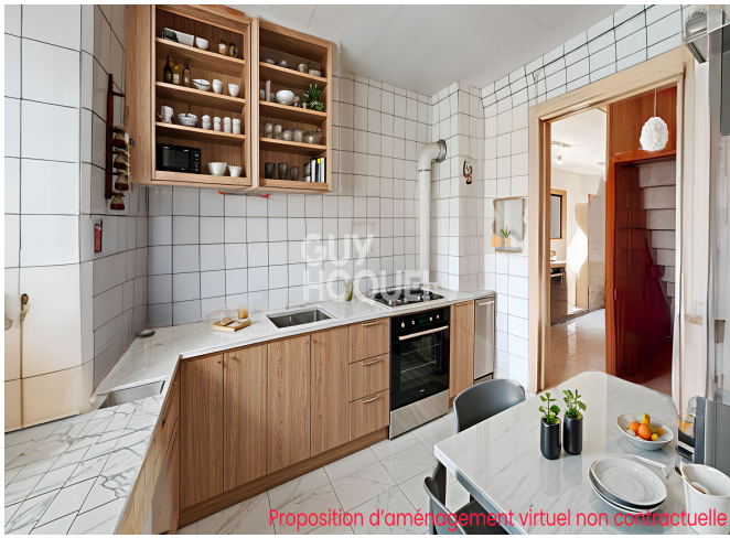
Proposition d'aménagement virtuel non contractuelle