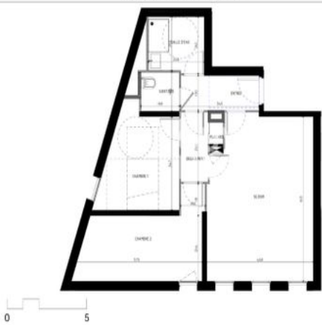
Plan de Pré-commercialisation