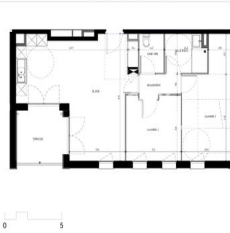
Plan de Pré-commercialisation