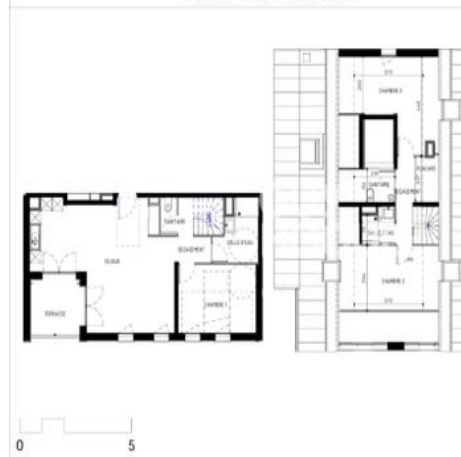
Plan de Pré-commercialisation