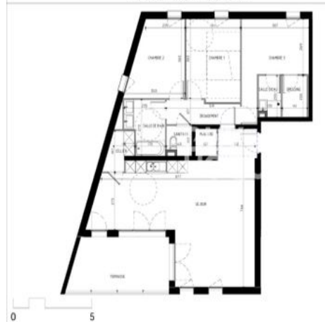
Plan de Pré-commercialisation