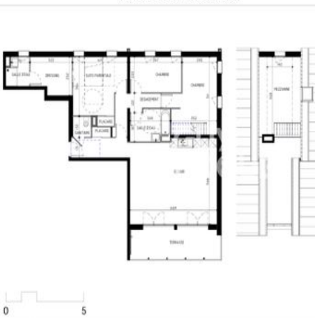
Plan de Pré-commercialisation