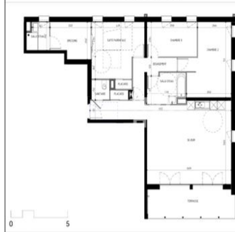
Plan de Pré-commercialisation