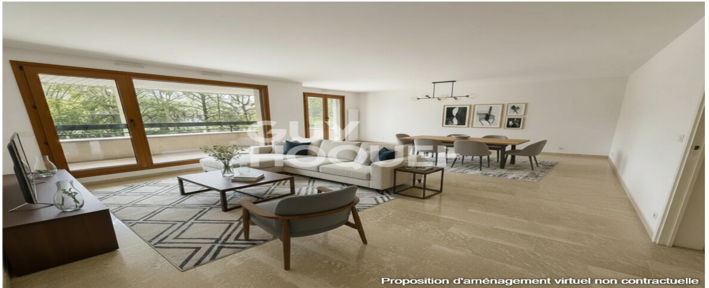
Proposition d'aménagement virtuel non contractuelle